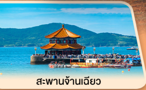
สะพานจ้านเฉียว

ชายหาดซาโจ่ว โรงงานเบียร์ซิงต้า ชมทุ่งดอกพื้งค์มอส ชายหาด NO.3