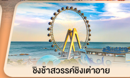
ชิงช้าสวรรค์ซิงเต๋ออาย