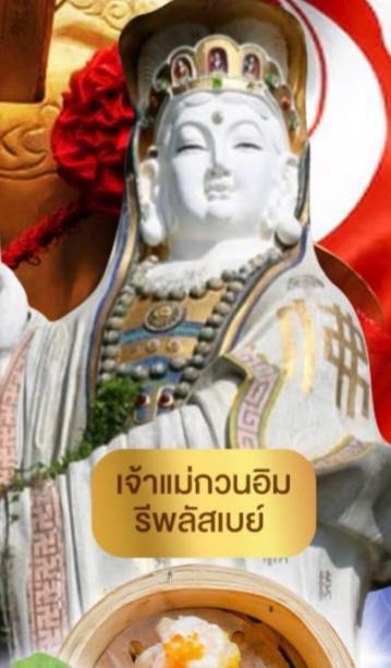
เจ้าแม่กวนอิม ริฟลิสเบย์