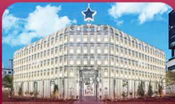
ย่านซองซู