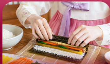
เรียงนำคิมฉับ

สัมผัสเสน่ห์ฤดูหนาวของเกาหลีแบบอบอุ่นหัวใจพิเศษ! พักรีสอร์ท 1 คืน ท่ามกลางบรรยากาศหิมะขาวโพลน สนุกกับกิจกรรมฤดูหนาวยอดนิยม ทั้งสกี สโนว์บอร์ดและสโนว์สไลด์ ก่อนออกเดินทางสู่เกาะนามิ ดินแดนแห่งความโรแมนติก ซิมสตรอว์เบอร์รี่หวานซ่า สด ๆ จากฟาร์ม พร้อมเรียนทำคิมฉับเมนูยอดฮิตสไตล์เกาหลี ปิดท้ายด้วยการช้อปปิ้งสุดฟินที่มีมงกุฎและของขวัญ ย่านฮิดดี้สายคาเฟ่และสายแฟชั่นห้ามพลาด