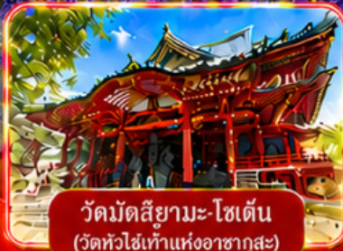
วัดมัตสึยามะ-โชเด็น (วัดหัวไข่แห่งอาซากุสะ)