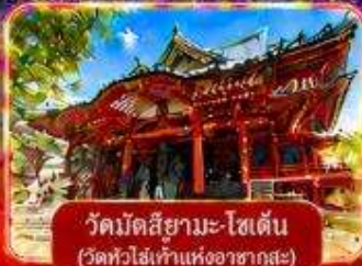
วัดมิตสึยามะ-โชเต็น (วัดหัวไร่แก้งแห่งอาซากุสะ)