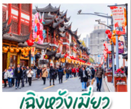
เมืองเซี่ยงเหมียว