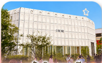
บรู๊กลินเกาหลี่