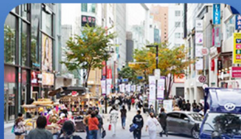
ช้อปปิ้งผ่านเม็ฆดง