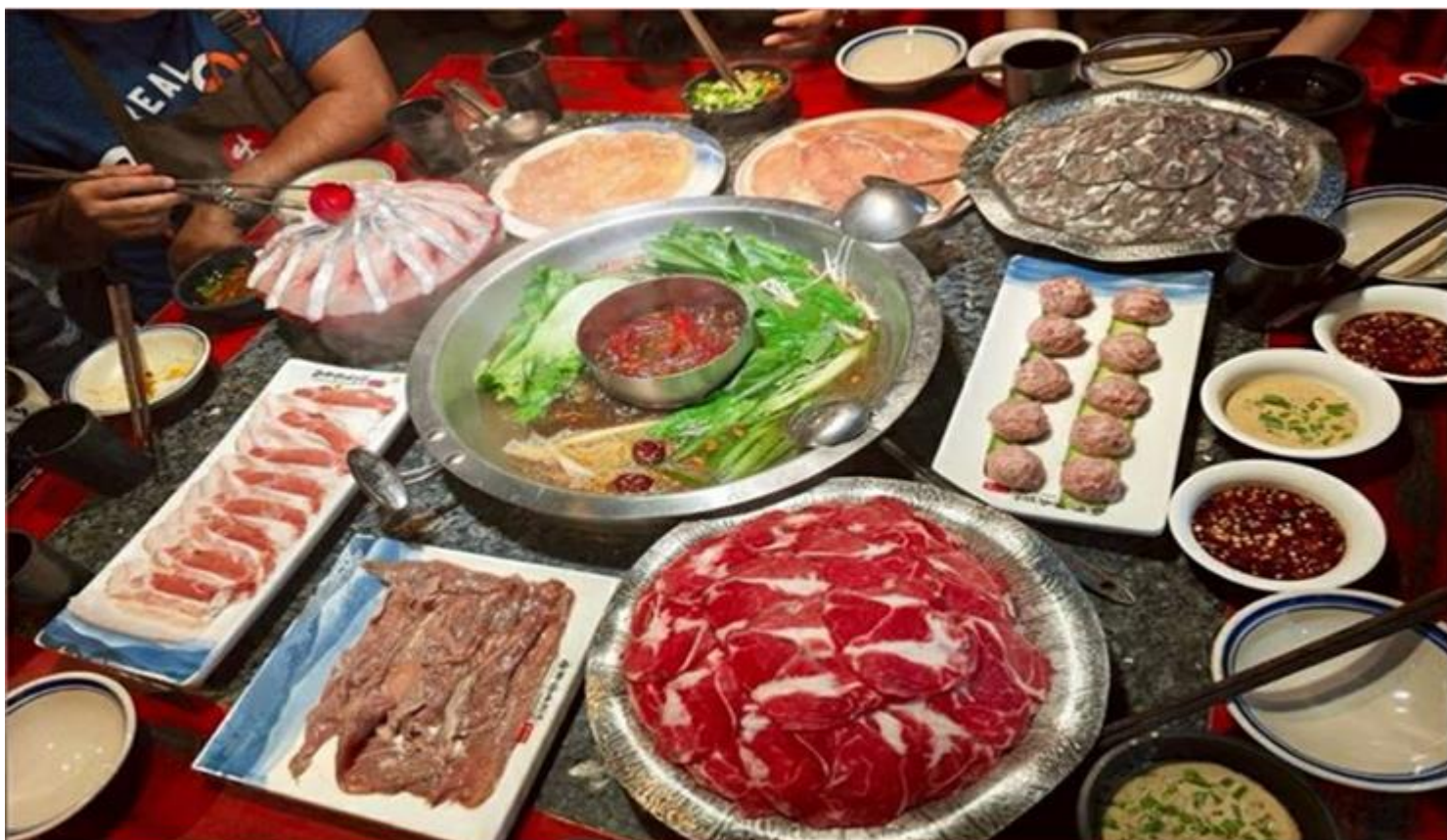
คำ รับประทานอาหารค่ำ ณ ภัตตาคาร (เมื่อที่ 12) *เมนูพิเศษสุกี้หม่าล่าเสฉวน

ดั้งเดิม มีทั้งแบรนด์แฟชั่นระดับโลกอย่าง Gucci, Chanel, Balenciaga รวมถึงร้านค้าไลฟ์สไตล์และแฟชั่นท้องถิ่น อาหารท้องถิ่นและคาเฟ่นานาชาติสวยๆ ที่เหมาะสำหรับการนั่งพักผ่อน