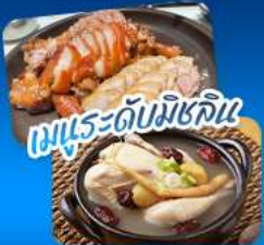
เมนูระดับมิชลิน

เที่ยวชม 3 เมืองฮิต โซล - แทกู - ปูซาน สัมผัสเสน่ห์เกาหลีหลากหลายสไตล์ • ชมพระราชมังคลาภิเษก ตึก Lotte World Tower พร้อมจุดชมวิว Seoul Sky ในกรุงโซล • ชิคอินถนน Art Street ตามรอย BTS ตลาดชอมนุน • แลนด์มาร์ก 83 Tower ที่แทกู • ปักถ่ายที่ปูซานกับวัดแดงยงกุงซา หมู่บ้านวัฒนธรรมคิมซอน โซลที่นั่งรถไฟสายแคบชุลลิมวีกะเลสูดประทับใจ • เดินทางสะดวกด้วยรถไฟความเร็วสูง KTX อิมมอร์ทัลกับเมนูพิเศษ จากเกาหลีและไต้หวันพรีเมียมระดับมิชลิน เก็บครบทุกความประทับใจในทริปเดียว