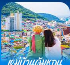
หมู่บ้านดัมเชอน