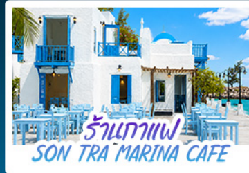
ร้านอาหาร SON TRA MARINA CAFE