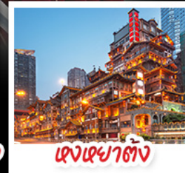
ตึกหยาดัง