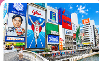
ชินโซบาชิจิ