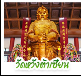
วัดเซว้งต้าเซียน

พัก 4 ดาว ย่านช้อปปิ้งจิมซาจуйหรือย่านมงก๊ก สนุกสนานไปกับสวนสนุกดิสนีย์แลนด์แบบเต็มวัน (รวมรถรับ-ส่ง) วัดหวังต้าเซียน หอพระด้านสุขภาพ • วัดเขangkหมิว หอพระโชคลาภ การฝึกและธุรกิจ • เจ้าแม่กวนอิมฮ่องกงฯ นมัสการองค์เจ้าแม่กวนอิม ที่มีอายุกว่า 600 ปี • นั่งกระเช้าเองปีงสิการะพระใหญ่เทียนถาน