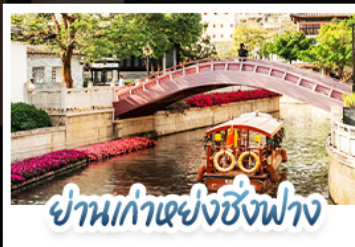
ย่านเก่าแห่งซังฟง