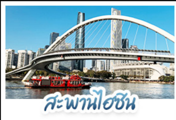
สะพานไอซิน