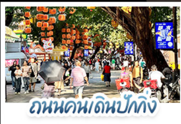
ถนนคนเดินปิกกิง