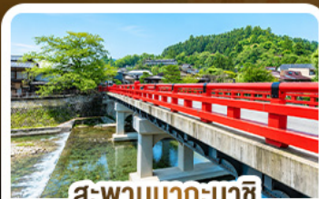
สะพานนากะบาชิ ทาดายามา