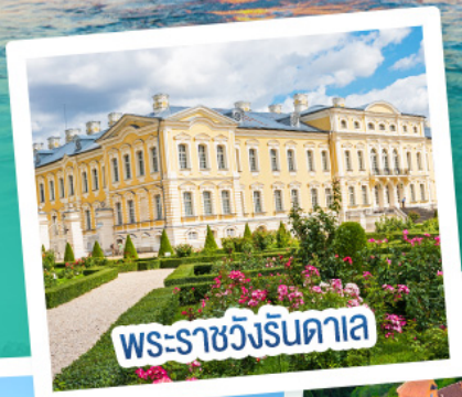
พระราชวังรินดาคาล