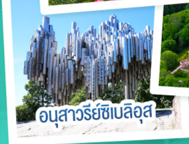
อนุสาวรีย์ซีเบลึส