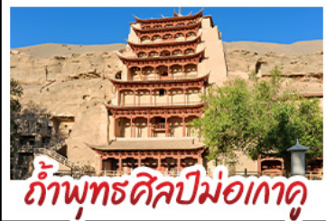
กำแพงศิลปะมอเกาคุ

มินิพระราชวัง - สระน้ำงพระจันทร์ ทะเลสาบเกลือฉางซ่า - กำแพงศิลปะมอเกาคุ หุบเขาสายรุ้งจางเย่ - ทะเลสาบชิงไห่