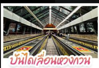
บันไดเลื่อนแขวงกวาน