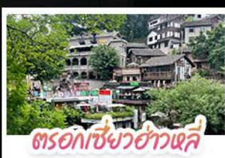
ตรอกเซียวฮ่าวเฉลิ