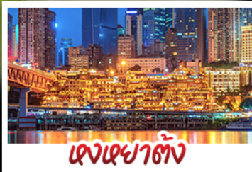
แสงเซาตั้ง