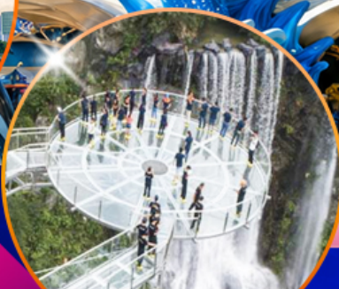
สะพานแก้วคู่หลงเซี่ยะ