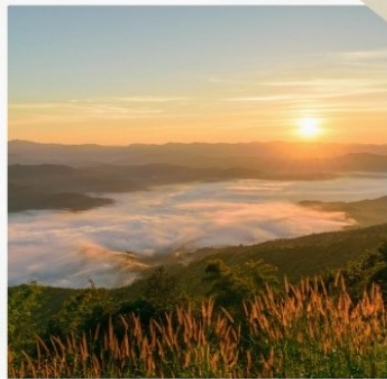
ทอย (สมอทาว)