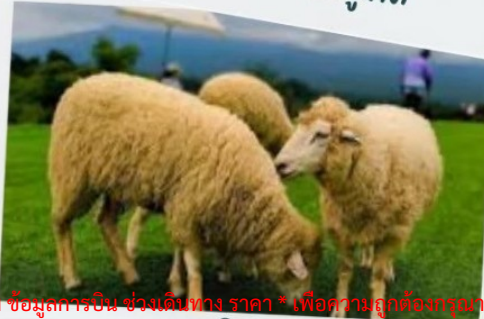
ฟาร์มแกะ