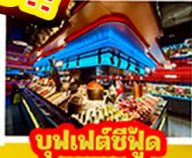
บุฟเฟ่ต์ซีฟู้ด