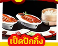
เปิดบ๊ักกิ้ง