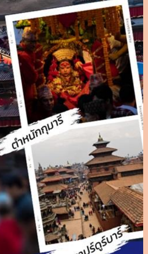
ตำนานกฤษี