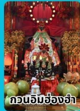
กวนอิมฮ่องกง