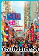
ช้อปปิ้งจิมซาจี้