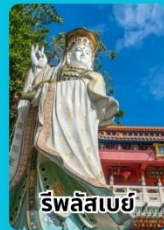
ริวัลลิสเบย์