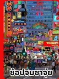
ช้อปปิ้งจตุรัส