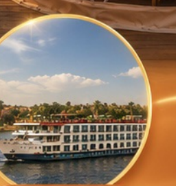
ล่องเรือแม่น้ำไนล์