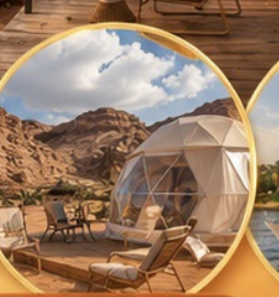
แคมป์กลางทะเลทราย