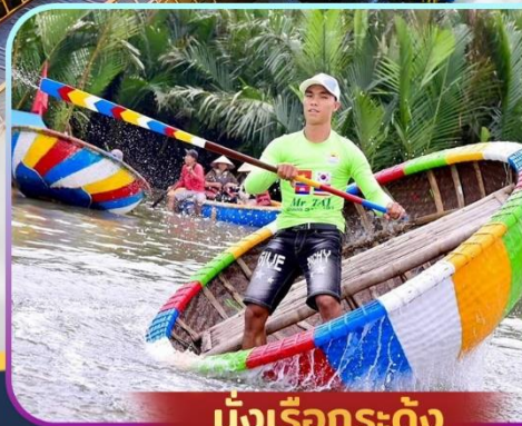
นั่งเรือกระด้าง