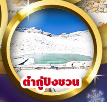
ต่ากู่ปิงชว่น