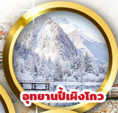
อุทยานปี้เฟิงโกว