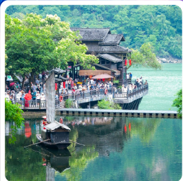
หมู่บ้านชาวน้ำเสี่ยเหรินเจีย