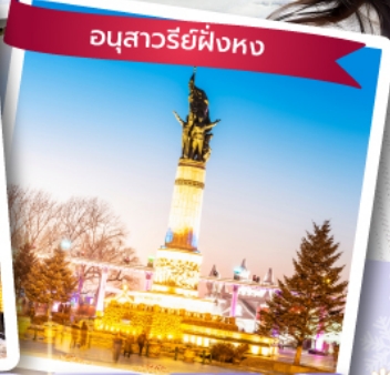
อนุสาวรีย์ผึ้งหง