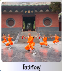
โชว์กังฟู