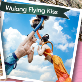
Wulong Flying Kiss