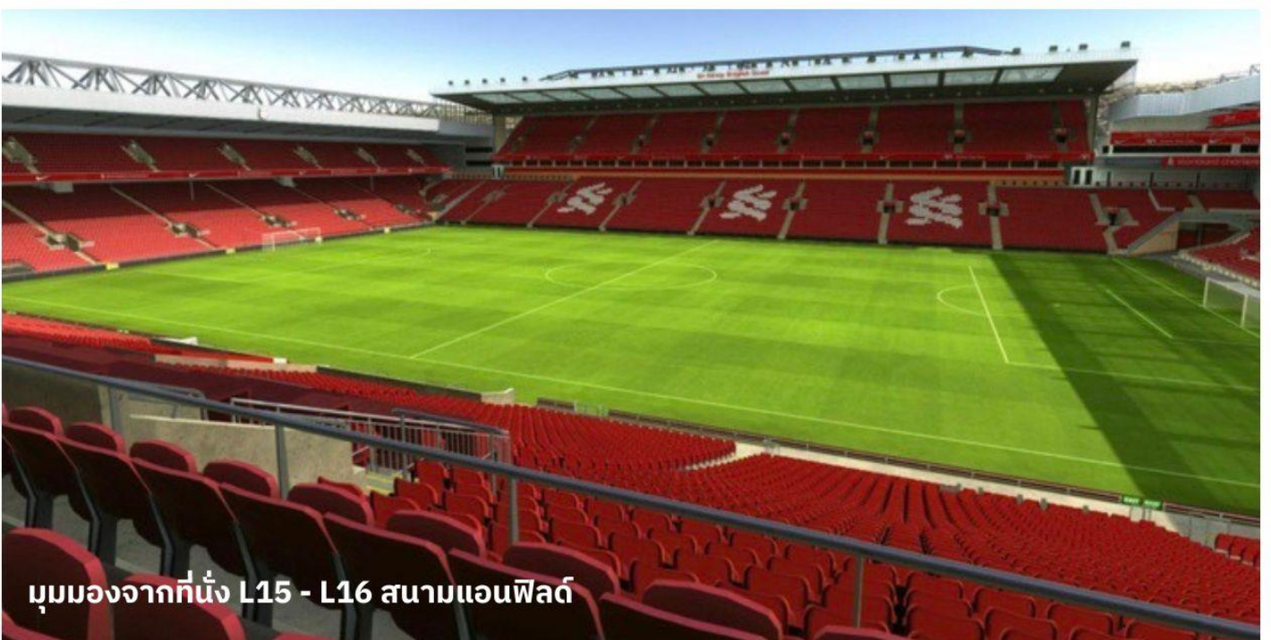
มุมมองจากที่นั่ง L15 - L16 สนามแอนฟิลด์

นำท่านเข้าสู่ที่พัก Mercure Liverpool Atlantic Tower Hotel หรือเทียบเท่า