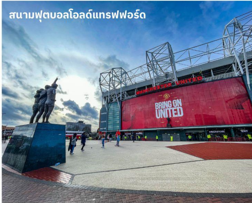
สนามฟุตบอลโอลด์แทรฟฟอร์ด

จากนั้นนำท่านเดินทางสู่ เมืองแมนเชสเตอร์ ใช้เวลาเดินทางประมาณ 1 ชั่วโมง เป็นอีกหนึ่งเมืองท่าที่สำคัญของประเทศอังกฤษและยังเป็นเมืองที่มีประชากรมากที่สุดเป็นอันดับสองของประเทศอังกฤษ รองจากมหานครลอนดอน จากนั้นนำท่านถ่ายรูปด้านหน้า สนามฟุตบอลโอลด์แทรฟฟอร์ด แห่งทีมแมนเชสเตอร์ ยูไนเต็ด สโมสรฟุตบอลชื่อดังโลกที่มีสมาชิกแฟนคลับมากที่สุดในโลก เจ้าของสมญานาม “ปีศาจแดง” สนามเริ่มก่อสร้างในปี 1909 และเริ่มใช้ตั้งแต่ปี 1910 ปัจจุบันมีความจุ 76,212 คน