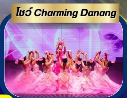
โชว์ Charming Danang