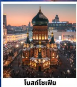
โสมสโซเฟีย