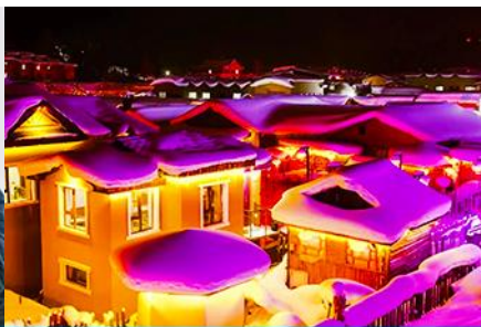
เมืองหิมะ Xue xiang