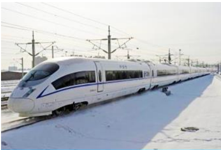
รถไฟความเร็วสูง