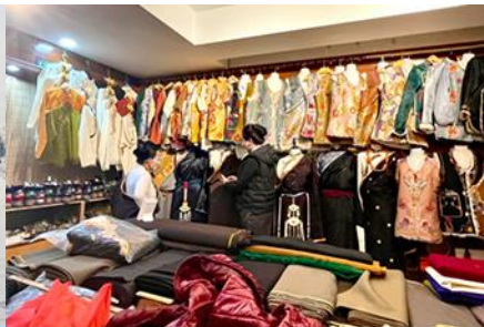
ศูนย์จำหน่ายอุปกรณ์กันหนาว