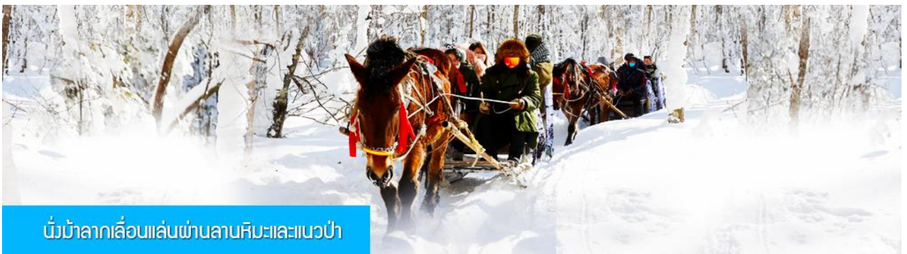
นั่งม้าลากเลื่อนเล่นผ่านลานหิมะและแนวป่า

รายการที่ 1 ระเบียบเดินชมวิว ภาพเขียนสิบลิ 冰雪十里画廊 เป็นการเดินชมวิวธรรมชาติตามเนินเขา ท่ามกลางแนวป่าที่มีต้นไม้ที่มีน้ำแข็งเกาะอยู่ตามกิ่งไม้ เป็นภาพวิวธรรมชาติฤดูหนาวที่สวยงามน่าประทับใจและพบได้เฉพาะในฤดูหนาวทางภาคอีสานของจีนเท่านั้น เวลาที่ใช้สำหรับ โปรแกรมเสริมนี้ประมาณ 1 ชั่วโมง อัตราค่าบริการ ท่านละ 220 หยวน หรือ 1100 บาท อัตรานี้รวมค่าบริการผ่านเข้าอุทยาน ค่ารถรับ ส่ง และค่าบริการของไกด์ท้องถิ่น และค่าบริการจัดการของบริษัททัวร์ท้องถิ่น.....หมายเหตุ โปรแกรมเสริมเป็นโปรแกรมที่ท่านต้องเสียค่าใช้จ่ายเองด้วยความสมัครใจ สำหรับท่านที่ไม่เข้าร่วมกิจกรรมดังกล่าวสามารถนั่งพักในรถได้