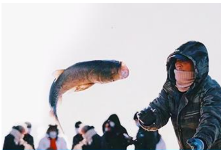
การจับปลาในฤดูหนาว

นำท่านชม การจับปลาในฤดูหนาว 冬捕 เป็นวิธีการจับปลาตามแม่น้ำและแหล่งน้ำในฤดูหนาวที่สืบทอดกันมายาวนาน โดยชาวบ้านจะนำแหดักปลามาวางดักไว้ตามจุดต่าง ๆ ก่อนที่ผิวน้ำจะปกคลุมด้วยน้ำแข็ง หลังจากผิวน้ำกลายเป็นน้ำแข็งแล้ว ชาวบ้านจะเจาะพื้นน้ำแข็งบริเวณที่วางดักอยู่เพื่อยกแหขึ้น จะมีปลาติดแหเป็นจำนวนมาก...พิเศษ ให้ท่านได้ชมการยกแหดักปลาจากสถานที่จริง และให้ท่านได้ชิมซุปรเนื้อปลาสด ๆ ที่ได้จากแหดักปลา