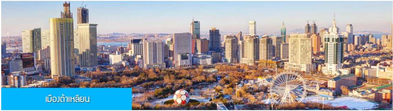
เมืองต้าเหลียน