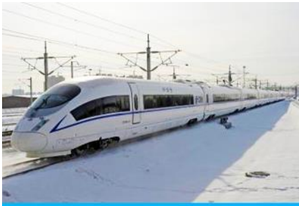
รถไฟความเร็วสูง