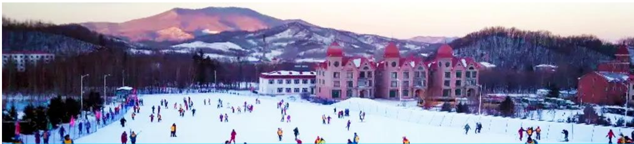
ลานสกียาบูลิ