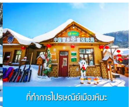
ที่ทำการไปรษณีย์เมืองหิมะ

วันที่สี่ พิพิธภัณฑสถานเมืองหิมะ – ที่ทำการไปรษณีย์เมืองหิมะ - ไกด์ขายออฟชั่น ภาพเขียนสิบลี-และ ออฟชั่น ม้าลากเลื่อน-เมืองฮาร์บิน