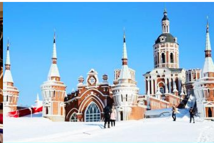
สวน LITTLE RUSSIA