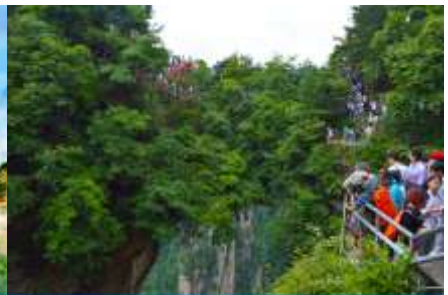
สะพานหนึ่งใบใต้หล้า

วันที่หก จางเจียเจี๋ย-จีน-ลงลิฟท์แก้วเที่ยวเขาเทียนจื่อซาน-ภูเขาอวตาร-สะพานหนึ่งใบใต้หล้า -ออฟชั่นะจก สะพานกรจกข้ามเขาแกรนด์แคนยอน