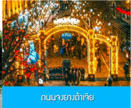
ถนนจางต้าเจีย