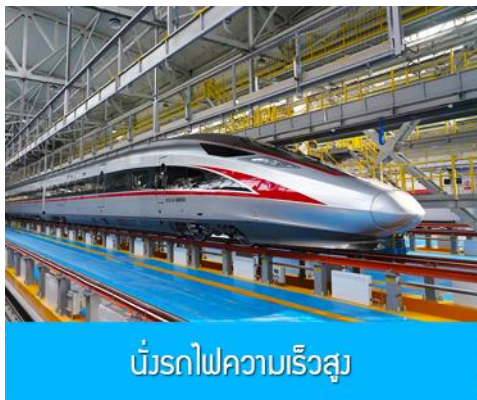
เบียร์รถไฟความเร็วสูง

หลังอาหารนำท่านเดินทางสู่สถานีรถไฟความเร็วสูงเมืองฮาร์บิ้น เตรียมขึ้นรถไฟความเร็วสูงสู่กรุงปักกิ่ง