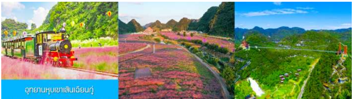
อุทยานหุบเขาเสินเจียนกู่