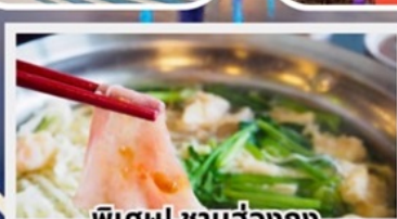
พิเศษ! ซาบูฮ่องกง