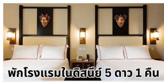
พักโรงแรมในดิสนีย์ 5 ดาว 1 คืน