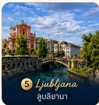
5 Ljubljana ลูบลียานา