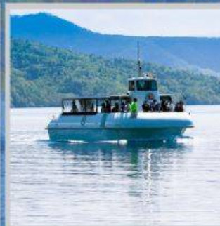
"LAKE SHIKOTSU GLASS BOAT"