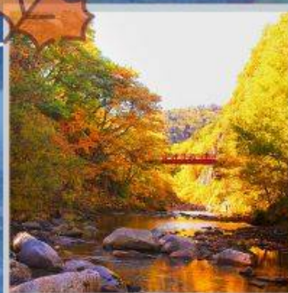
"JOZANKEI FUTAMI BRIDGE"