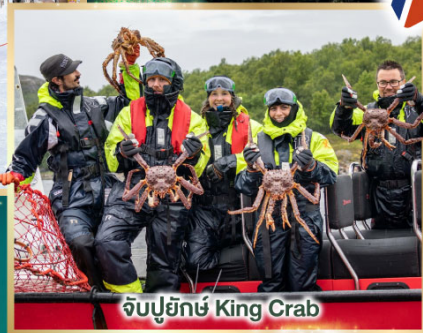
จับปูยักษ์ King Crab