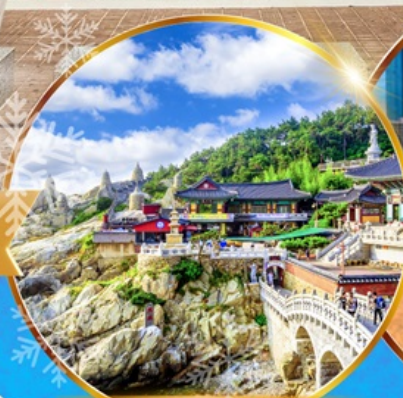
วัดแสงยงกุงซา