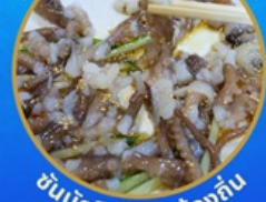
ชั้นนักชี อาหารท้องถิ่น