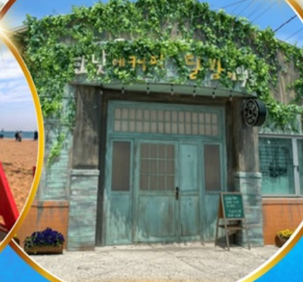
ตามรอยซีรีส์ดัง Hometown chachacha

โพล้งสเปซวอล์ค สกายวอร์ค ตามรอยซีรีส์ Hometown chachacha ถ่ายรูปชิคๆ หมู่บ้านวัฒนธรรมคิมซอน ขึ้นเคเบิลคาร์ ชมทะเลปูซาน นั่งรถไฟปูคปิก sky capsule ชิมของอร่อยตลาดแฮนแด อิสระช้อปปิ้ง Lotte Duty Free