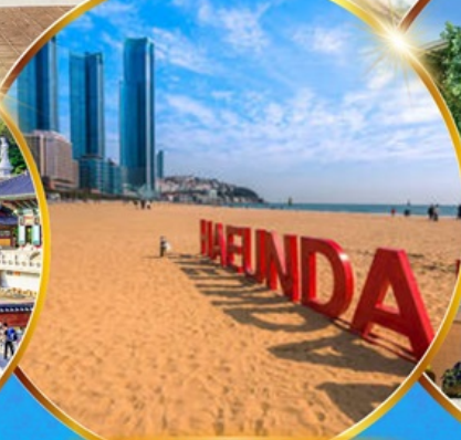
หาดแฮนแด