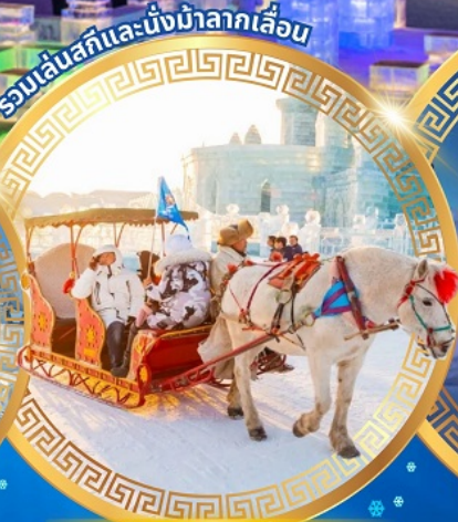
นั่งรถม้าลากเลื่อน