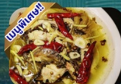
ปลาต้มผักกาดดอง