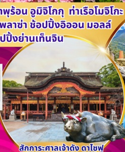
สักการะศาลเจ้าดัง ดาไซฟู