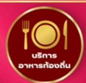
บริการ อาหารท้องถิ่น